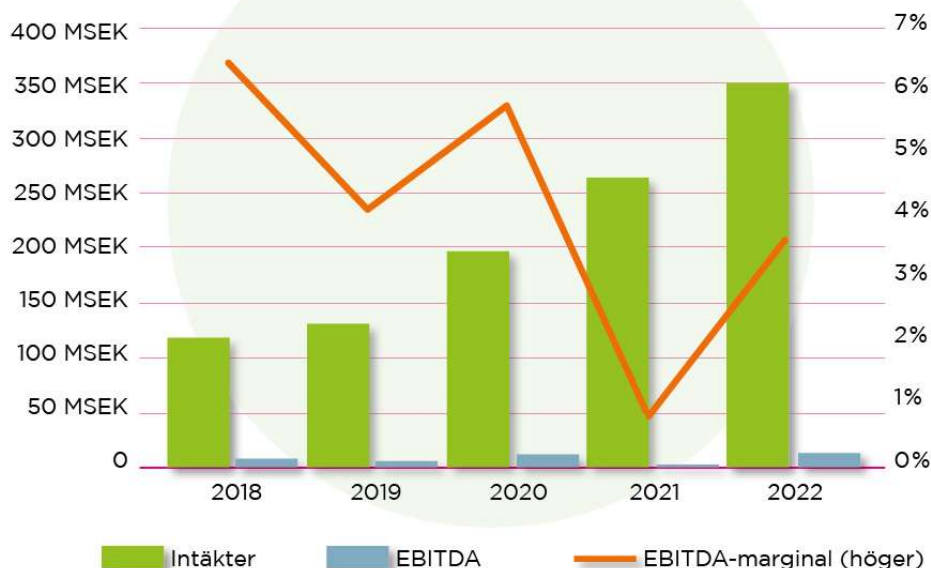
Tellusgruppens långsiktiga ekonomiska utveckling